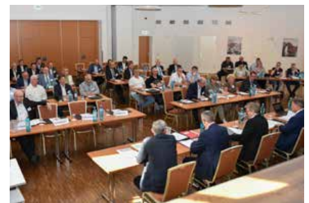
Die Gründungsversammlung mit Vertretern der Innungen aus den drei Städten Dortmund, Hagen und Lünen bestimmte in Herdecke den neuen Vorstand.

gewicht im östlichen Ruhrgebiet sein. Nach den Vorstandswahlen 2024 soll es gemäß den bisherigen Planungen dann einen Kreishandwerksmeister geben und zwei Stellvertreter, die dann jeweils Stadthandwerksmeister in den beiden anderen Städten sind und dort auch entsprechendes Gewicht bei der Wahrnehmung handwerklicher Interessen haben.